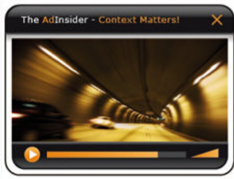
The AdInsider InText-Ads Ein Meister der Vielfalt: Von Rich-Media bis zur Mehrtextanzeige. Contextgesteuert und produktbezogen. Direkt und zielgruppenspezifisch.

Diskret Werben – Eine InText-Werbung ist erkennbar an doppelten Unterstreichungen von einzelnen Wörtern oder kurzen Textpassagen. Damit ist das Werbeformat unaufdringlich und ruft keine Reaktanz beim User hervor.